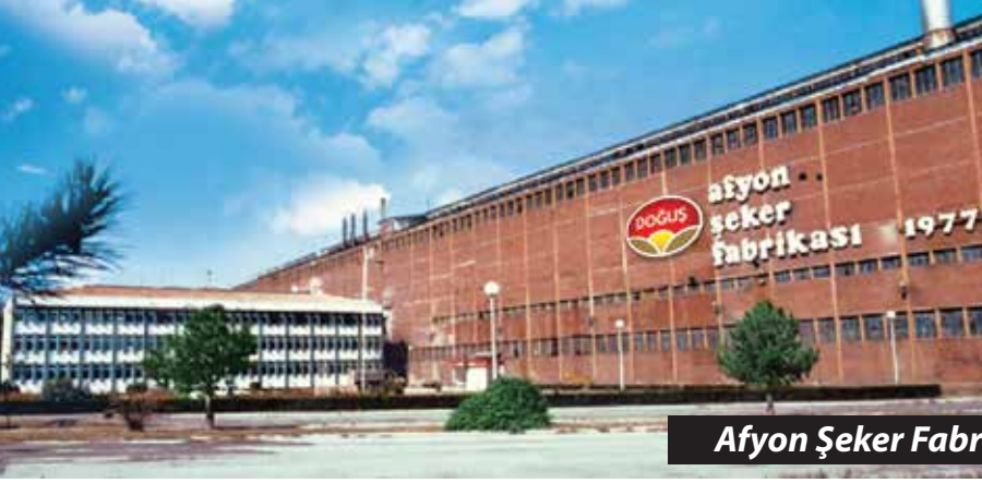
Afyon Şeker Fabrikası